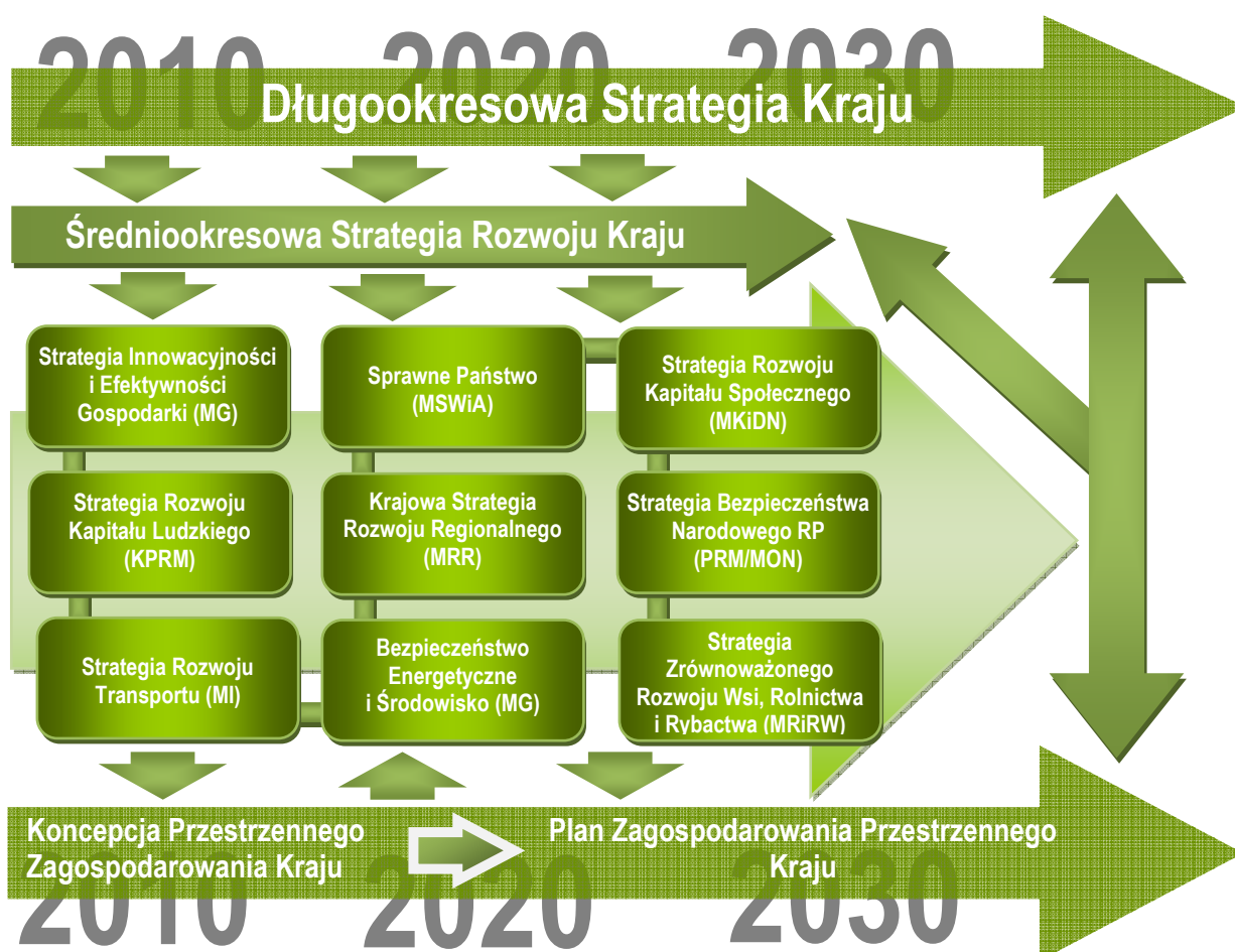
Rysunek: Nowy model zarządzania rozwojem kraju

będzie Średniokresowa Strategia Rozwoju Kraju z 10-letnim horyzontem czasowym, w korelacji z europejskim dokumentem programowym „Europa 2020”, oraz 9 zintegrowanymi strategiami dotyczącymi: Innowacyjności i Efektywności Gospodarki, Rozwoju Transportu, Bezpieczeństwa Energetycznego i Środowiska, Rozwoju Regionalnego, Rozwoju Kapitału Ludzkiego, Rozwoju Kapitału Społecznego, Zrównoważonego Rozwoju Wsi, Rolnictwa i Rybactwa, Sprawnego Państwa oraz Rozwoju Systemu Bezpieczeństwa Narodowego. Ważnym elementem porządku planowania strategicznego w odniesieniu do dokumentu „EU 2020” jest Krajowy Program Reform, a także cyklicznie aktualizowane: Wieloletni Plan Finansowy Państwa oraz Aktualizacja Programu Konwergencji.