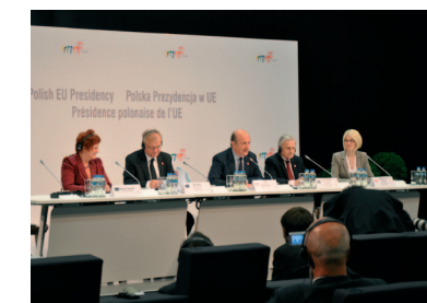
Posiedzenie Rady ECOFIN Wrocław 2011

Prezydencja Polski bezsprzecznie przyniosła Ministerstwu Finansów korzyści, do których zaliczyć należy m.in. większą pewność korzystania ze swojego głosu w UE oraz wzmocnienie obecności przedstawicieli MF w instytucjach europejskich. Jednocześnie należy również docenić pozytywne zmiany, takie jak na przykład sposób organizacji pracy Ministerstwa poprzez wykorzystanie zdobytych doświadczeń do dalszej poprawy skuteczności działania oraz sprawności organizacyjnej.