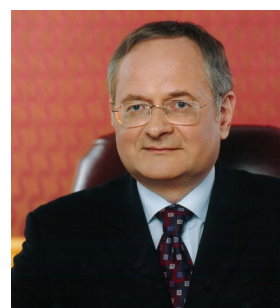
Andrzej Raczko (16.06.2003–21.07.2004)