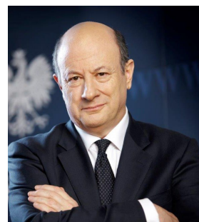
Jan Vincent-Rostowski (18.11.2011–27.11.2013; 16.11.2007–18.11.2011)