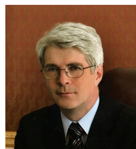
Mirosław Gronicki (21.07.2004–31.10.2005)