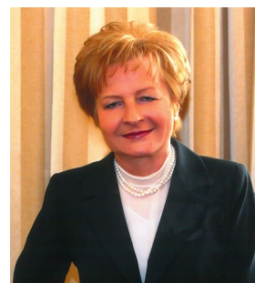
Zyta Gilowska (07.01.2006–24.06.2006)