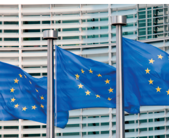
Flagi UE na tle budynku Komisji Europejskiej