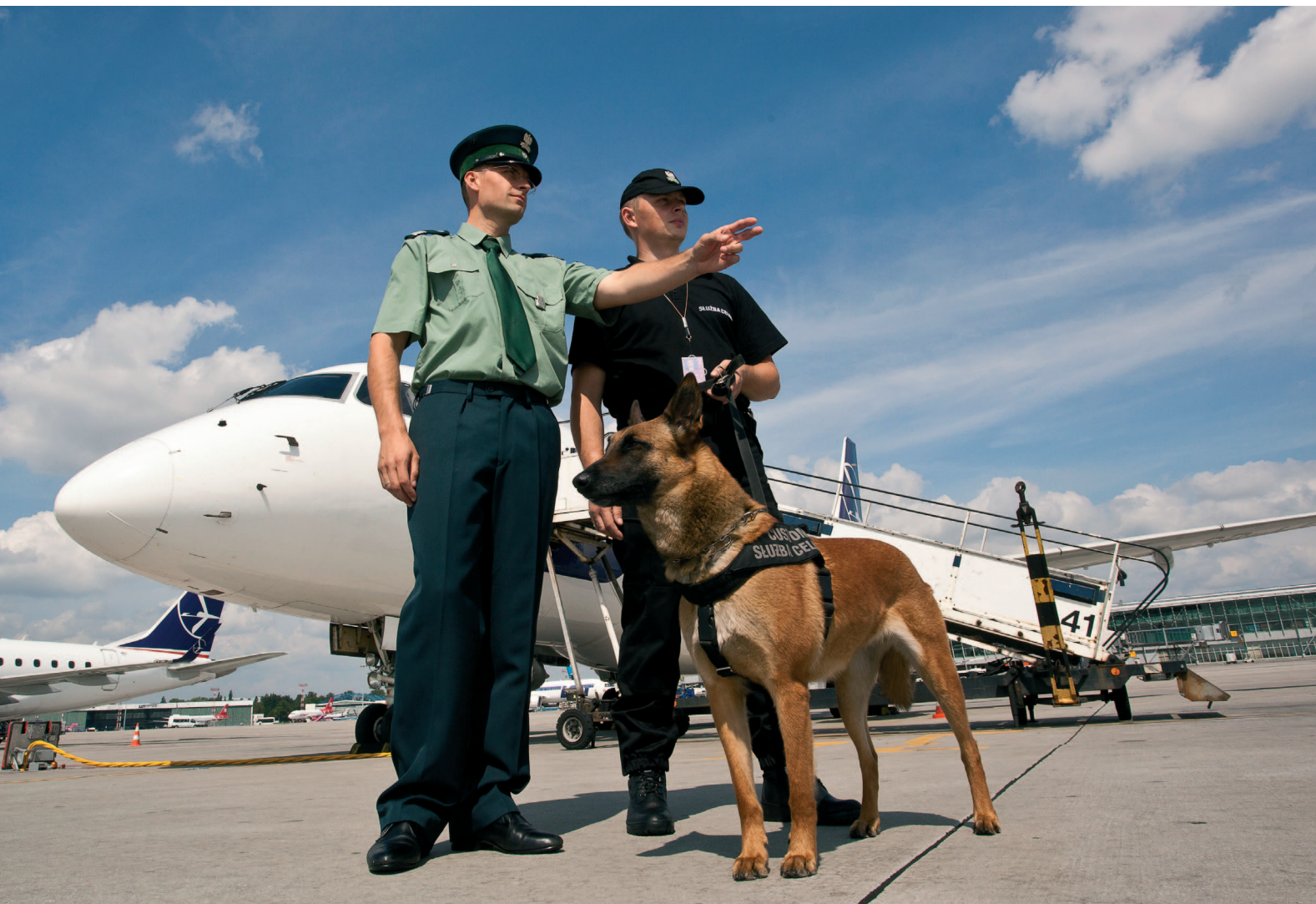
Służba Celna stoi na straży zewnętrznej granicy UE

bezpieczeństwu publicznemu czy środowisku naturalnemu oraz by interesy handlowe unijnych przedsiębiorców nie były naruszane.