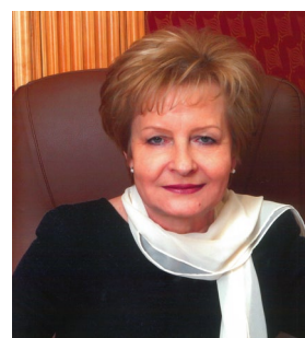
Zyta Gilowska (22.09.2006–16.11.2007)